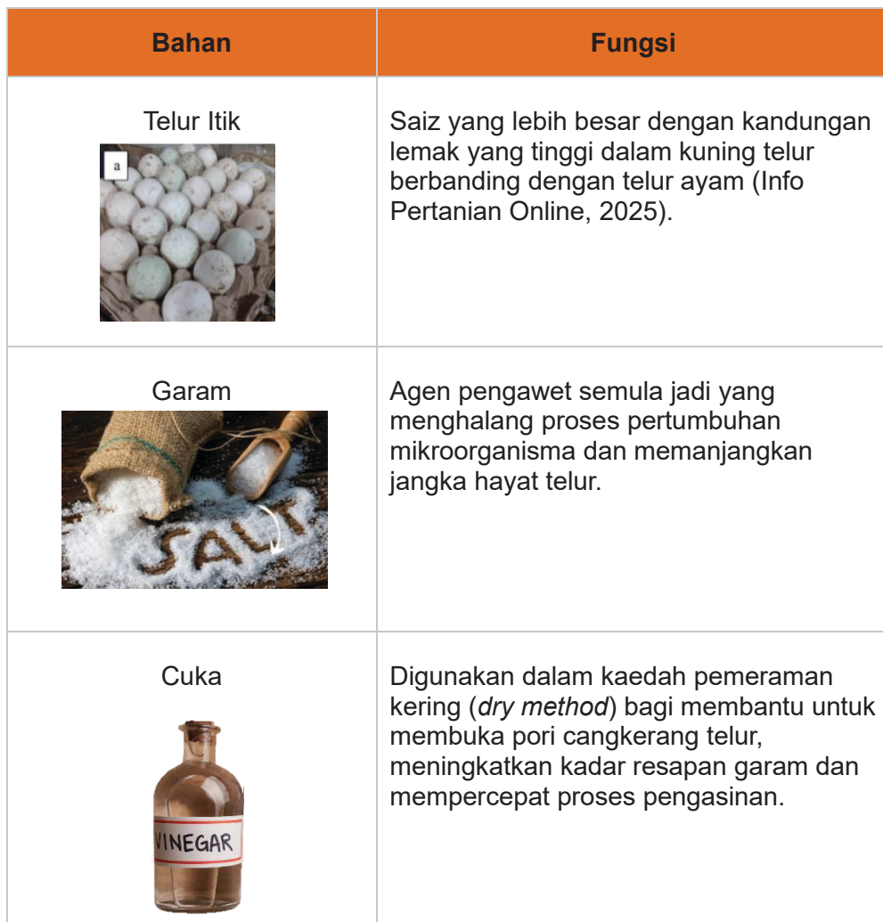
Jadual 2.1: Bahan-bahan Utama dalam Penghasilan Telur Itik serta Fungsinya

Dalam penyediaan telur masin, bahan-bahan utama yang digunakan ialah telur itik, garam dan cuka.