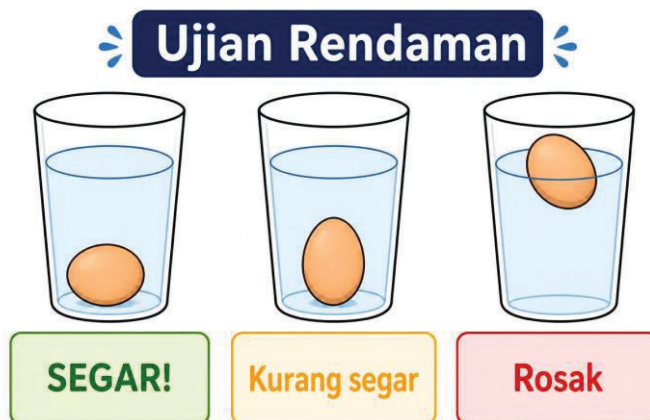
Rajah 4.1: Ujian Rendaman untuk Menilai Kesegaran Telur

Pemilihan telur juga harus berdasarkan kriteria saiz yang seragam, cangkerang yang utuh serta berat yang sesuai. Telur yang rosak atau ringan biasanya menandakan kehilangan kandungan dalaman dan tidak sesuai untuk diproses. Pemeriksaan secara visual dan ujian rendaman ( floating test ) juga boleh digunakan bagi menilai kesegaran telur; telur yang tenggelam dianggap segar manakala yang terapung menandakan kemungkinan sudah rosak (Rajah 4.1).